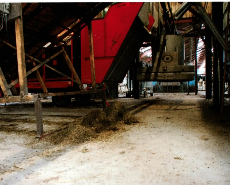
Grøn wilde geen geknoei van voer onder de bunker. De nieuwe bunker is daarom voorzien van een walking floor.