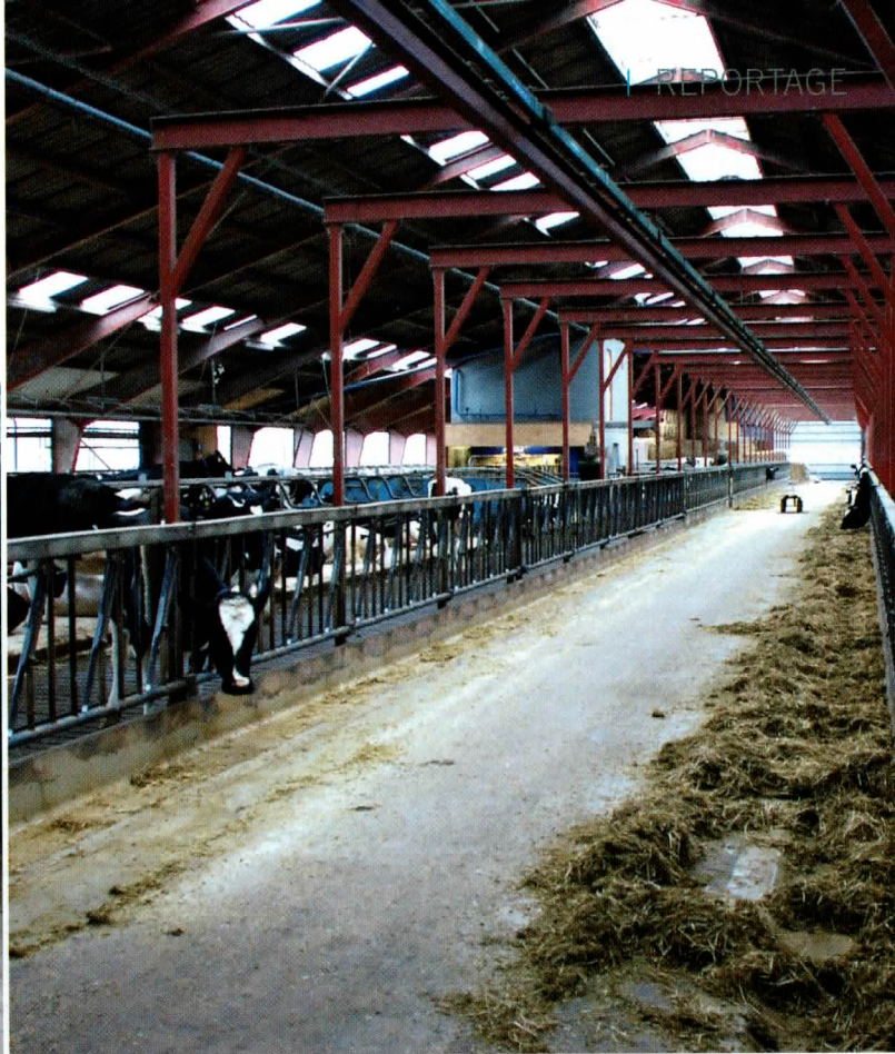
De voerrobot hangt aan een rail door de stal. Op de stroomrail staat constant 380 volt.

dan moet je gaan werken met een grote shovel voorzien van een flinke bak of kuilhopper, wat extra kosten met zich meebrengt. Terwijl de trekker met voorlader al op het bedrijf aanwezig is. In het voorjaar komt bij die 2 km ook nog eens de lengte van de kuil die je tot dan toe gevoerd hebt. Nu neem ik de bunker mee naar de kuil en kan ik met een kleinere trekker met voorlader eenvoudig en snel de bunker vullen zonder het hele erf onder te knoeien met voer”, aldus Grøn. Je kunt de bunker ook volzetten met grote pakken gras van een U-snijder. Dit zou de vultijd nog verder verkorten. Ook kan er dan meer product in de bunker. De opvoerketting zou geen problemen hebben met het verwerken van grote geperste balen of pakken van een U-snijder. “Als ik het gras na het vullen van de bunker een beetje aanduw met de voorlader, kan ik vier dagen van het gras voeren zonder dat het broeit”, vertelt Grøn.